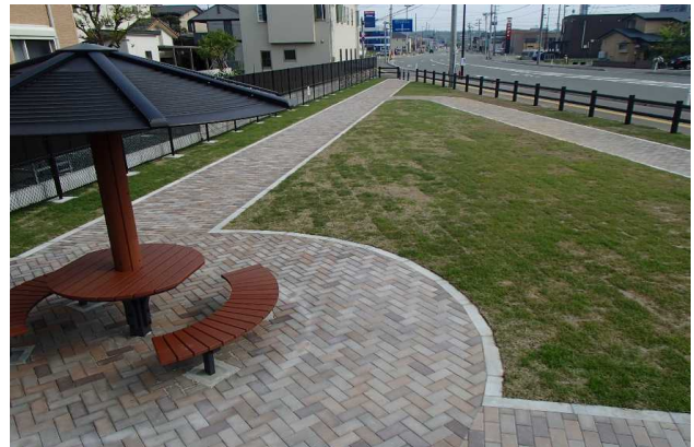
住宅市街地総合整備事業 (秋田駅東第三地区 公園整備)