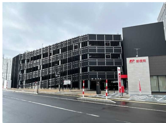
市街地再開発事業(横手駅東口第二地区)