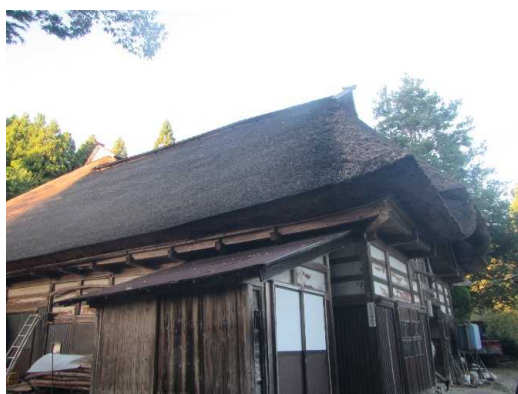
秋田市(下浜) (景観重要建造物整備)