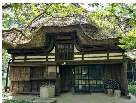
秋田市(仁井田) (景観重要建造物整備)