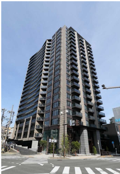
優良建築物等整備事業 (千秋久保田町地区 共同住宅)