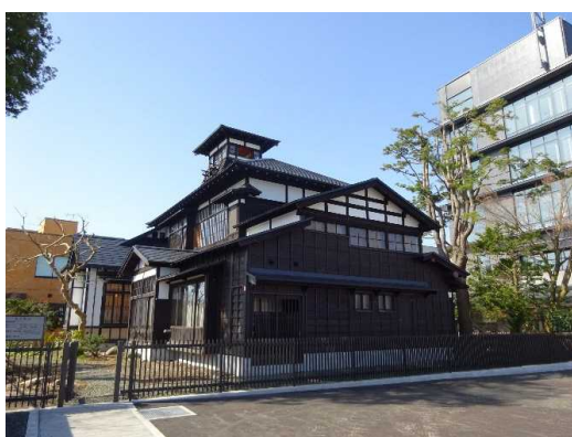
大館城下町地区 (歴史的風致形成建造物整備)